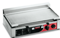
TOP X Timer