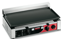
TOP L Timer